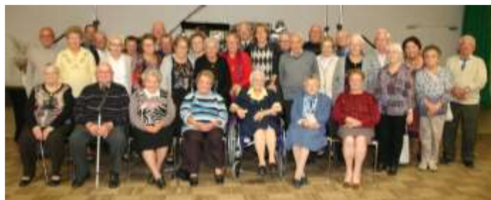
Les participants âgés de plus 80 ans

167 personnes ont participé au repas communal annuel qui a eu lieu le dimanche 9 octobre 2016.